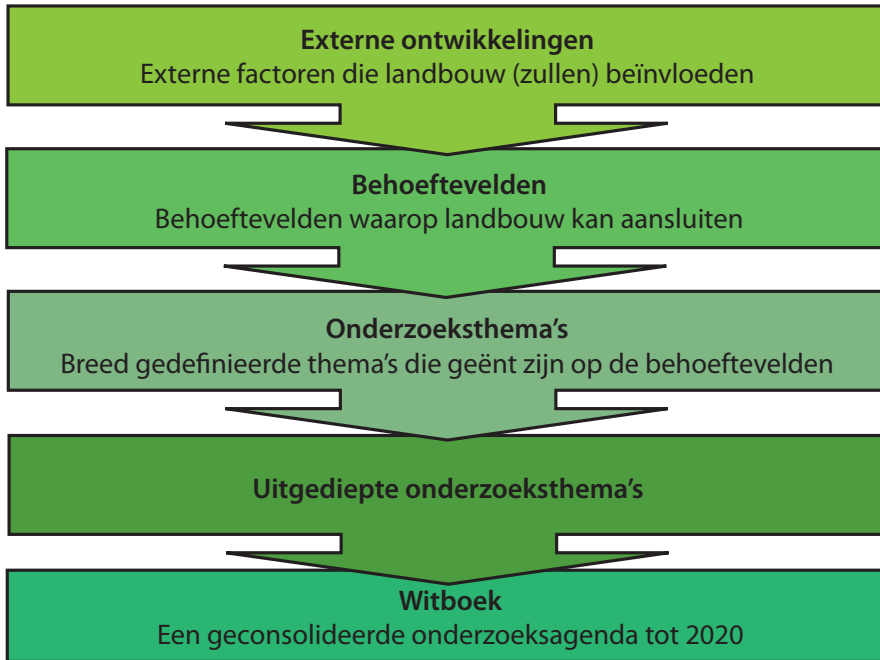
Figuur 1: Procesverloop van de opmaak van het Witboek Landbouwonderzoek

Het proces startte met een bevraging van een 40-tal binnen- en buitenlandse experts (zie bijlage 1) naar hun langetermijnverwachtingen voor de toekomst van de Vlaamse landbouw. Er werd gepeild naar de trends, opportuniteiten en knelpunten op mondiaal, Europees en Vlaams vlak en dit voor zowel voedingsproductie als niet-voedingsproductie en plattelandontwikkeling. Gecombineerd met de resultaten van een literatuurstudie gaf dit een beeld van de externe ontwikkelingen met een impact op de Vlaamse landbouw tot in 2020 (zie hoofdstuk 2). Algemeen kan men stellen dat het speelveld in en rond de landbouw zal gedomineerd worden door drie tendensen: