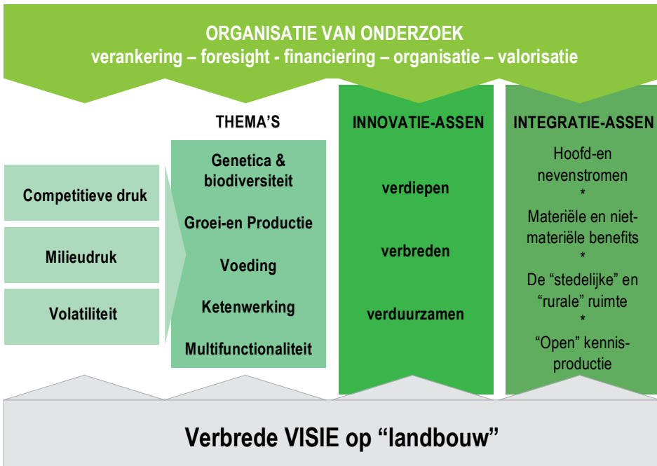
Figuur 2: Structuur van het Witboek Landbouwonderzoek

Samen moeten zij de overgang naar een nieuw, meer integratief landbouwparadigma toelaten. Het is een opvatting die geijkte tegenstellingen – zoals tussen hoofd- en nevenstromen in biomassa-productie, tussen de “stedelijke” en “rurale” ruimte, tussen materiële en niet-materiële baten – zal overstijgen in een meer holistisch concept waarbij landbouw opgevat wordt als de integrale waardecreatie op basis van biologische hulpbronnen. De opkomst van concepten zoals bio-based economy , multifunctionele landbouw en metropolitan agriculture kondigen deze transformatie al aan.